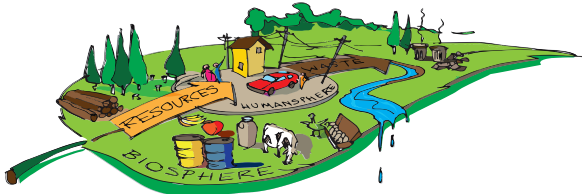
Figura 1. Demand for resource-intensive ultra-processed foods is increasing. Furthermore, large amounts of waste that cannot be degraded by the environment end up in food-related environments, threatening their biodiversity (1, 4).

Figura 1. Attualmente vi è una domanda crescente di alimenti ultra trasformati ad alta intensità di risorse. Inoltre, un'enorme quantità di rifiuti che non possono essere assorbiti dall'ambiente finisce negli ambienti alimentari e minaccia la loro biodiversità (1, 4).